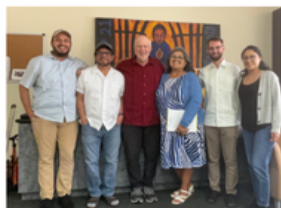
Jesuit Restorative Justice Initiative (JRJI) PREMIO HEARTS ON FIRE